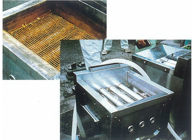
● 揚げ物用フライヤー