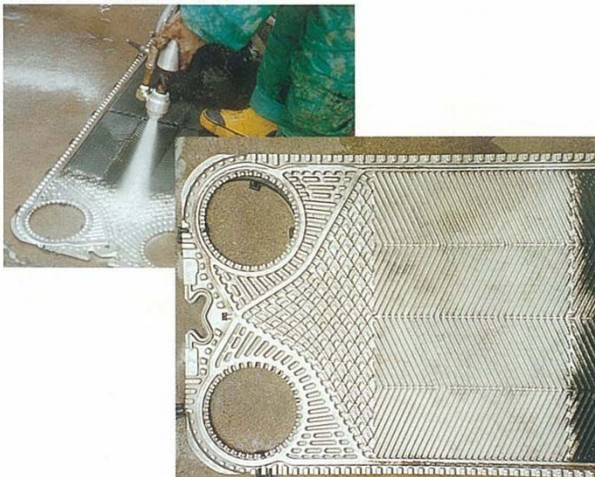
● プレート熱交洗浄