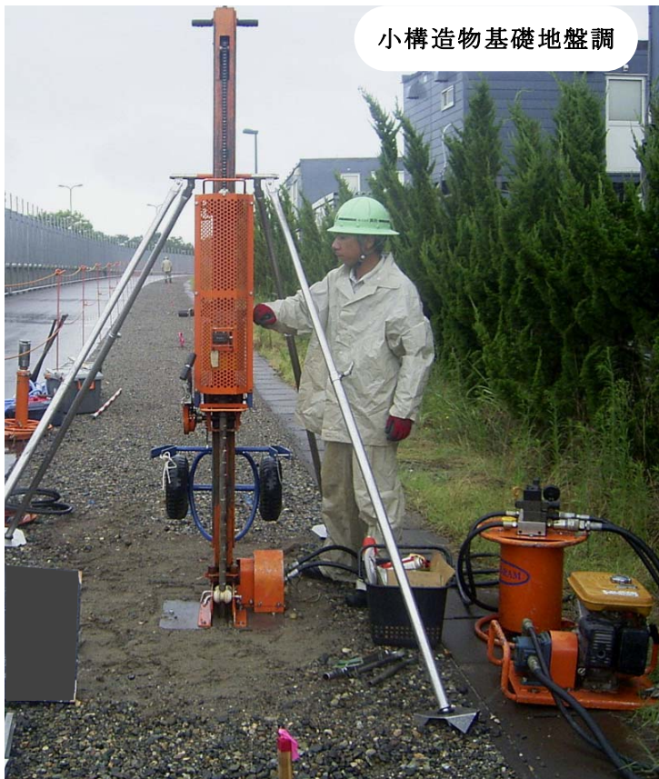
小構造物基礎地盤調